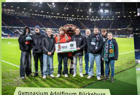
Gymnasium Adolfinum Bückeburg