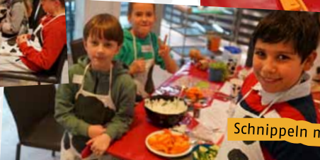
Schnippeln macht Spaß