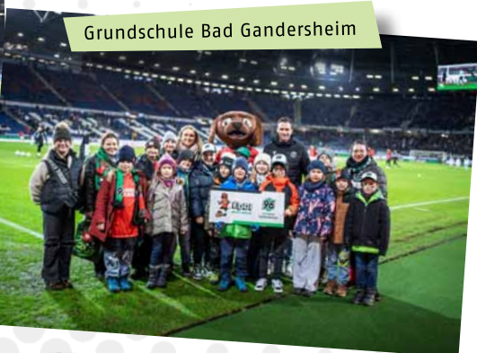
Grundschule Bad Gandersheim