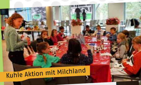
Kuhle Aktion mit Milchland