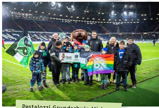
Pestalozzi Grundschule Misburg